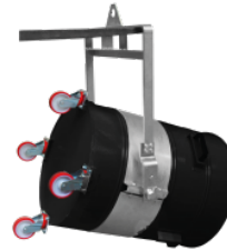
P01033 KIT VOLCANTE PARA CONTENEDORES – FIXACION Ø 450MM

Kit completo de accesorios específicos para la aspiración de polvo y sólidos de 40 mm de diámetro