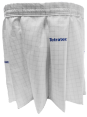
PTFE ANT Filtro antiestático PTFE (M clase EN 60335-2-69)