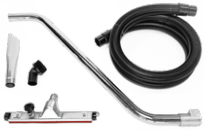
P12348 KIT POLVO Ø 50MM

Kit completo de accesorios específicos para la aspiración de sólidos y líquidos de 50 mm de diámetro