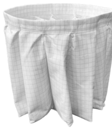
ANT M Filtro antiestático (M clase EN 60335-2-69)