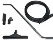
P13640 KIT POLVO Ø 40MM

Kit completo de accesorios específicos para la aspiración de polvo y sólidos de 50 mm de diámetro