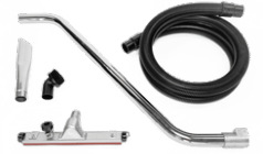
P11887 KIT WET & DRY Ø 50MM

Kit completo de accesorios específicos para la aspiración de sólidos y líquidos de 40 mm de diámetro