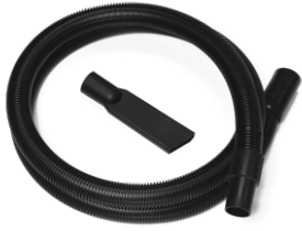
P13638 STARTER KIT Ø 40MM

Kit básico de accesorios específicos para la aspiración de sólidos y líquidos de 40 mm de diámetro