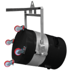
P11287 KIT VOLCANTE PARA CONTENEDORES – ANILLO Ø 450MM