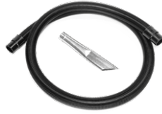
P12350 STARTER KIT Ø 50MM

Kit básico de accesorios específicos para la aspiración de sólidos y líquidos de 40 mm de diámetro