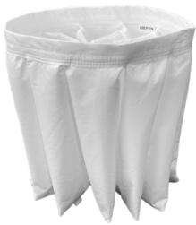
BFL Filtro clase M 38.000 cm 2