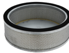
HEPA 14 Filtro absoluto (EN 1822) 22.000 cm 2 superficie filtrante Filtro antiestático clase H14 (EN 1822) Fibra de vidrio