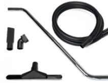
P13639 KIT WET & DRY Ø 40MM

Kit básico de accesorios específicos para la aspiración de sólidos y líquidos de 50 mm de diámetro