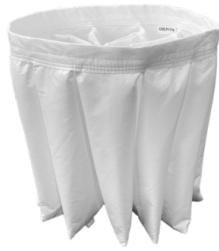
PTFE Filtro PTFE (M clase EN 60335-2-69)