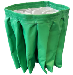
MTF Filtro Teflon (M clase EN 60335-2-69)