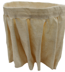
NOMEX Filtro resistente a 250° Celsius