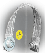
GRD Mise à la terre