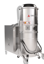
TX Chambre, Cuve et Structure en acier INOX AISI 304