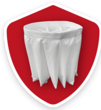
3 JAHRE GARANTIE Beim Kauf des Ersatzfilters zusammen mit dem Sauger