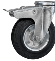
RAD MIT BREMSE Nicht spurtreues Rad mit integrierter Bremse