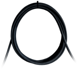
CABLU DE ALIMENTARE