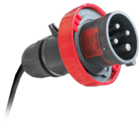
ATEX 4-POLIGER INDUSTRIESTECKER