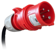
ENCHUFE Enchufe industrial de 4 polos