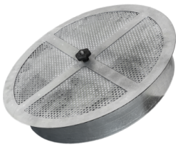
ACB Filtro de carbones activos Sistema de vaciado manual - válvula mariposa