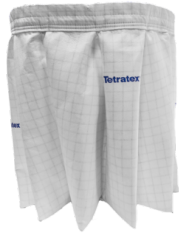
PTFE ANT Filtro antiestático PTFE (M clase EN 60335-2-69)