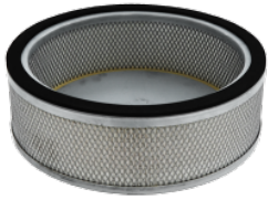
HEPA 14 Filtro absoluto (EN 1822) 22.000 cm 2 superficie filtrante Filtro antiestático clase H14 (EN 1822) Fibra de vidrio