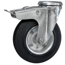
RUEDA CON FRENO Rueda con freno integrado