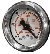
VACUÓMETRO Vacuómetro para señalar cuando el filtro está obstruido o necesita ser sustituido