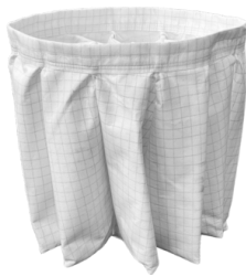
ANT M Filtro antiestático (M clase EN 60335-2-69)