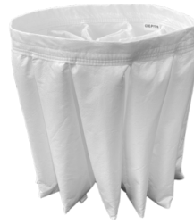
PTFE Filtro PTFE (M clase EN 60335-2-69)