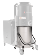
BX Contenedor en acero INOX AISI 304