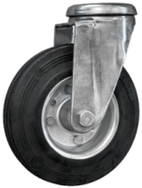
RUEDAS Ruedas pivotantes que no dejan marcas