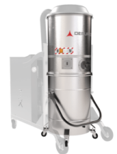
GX Cámara y contenedor en acero INOX AISI 304a