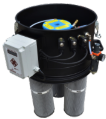
SP Sacudidor cartuchos par contra corriente de aire