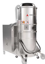
TX Cámara, Contenedor y Estructura en acero INOX AISI 304