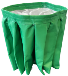
MTF Filtro Teflon (M clase EN 60335-2-69)