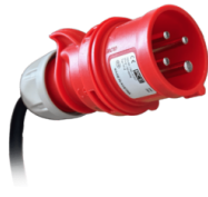
ENCHUFE Enchufe industrial de 4 polos