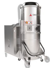
TX Cámara, Contenedor y Estructura en acero INOX AISI 304