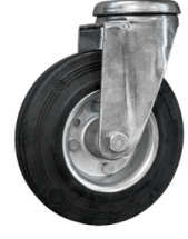
RUEDAS Ruedas pivotantes que no dejan marcas