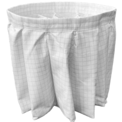
ANT M Filtro antiestático (M clase EN 60335-2-69)