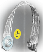
GRD Puesta a tierra