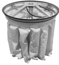
PSC Sacudidor filtro neumático semiautomático