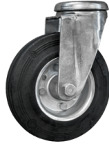
RUEDAS Ruedas pivotantes que no dejan marcas