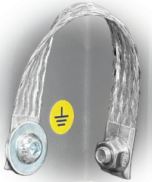
GRD Puesta a tierra