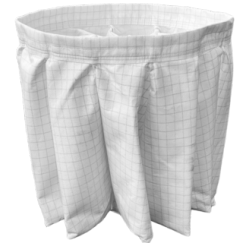
ANT M Filtro antiestático (M clase EN 60335-2-69)