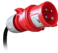
ENCHUFE Enchufe industrial de 4 polos