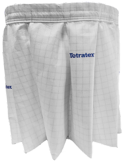
PTFE ANT Filtro antiestático PTFE (M clase EN 60335-2-69)