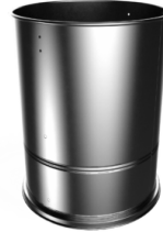
CONSTRUCCIÓN DE ACERO Robusta construcción industrial de acero pintado