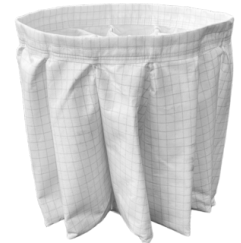
ANT M Antistatischer Filter (M Klasse EN 60335-2-69)