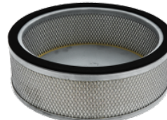
HEPA 14 Absolutfilter (EN 1822)