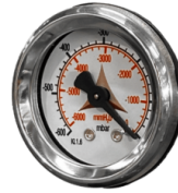
VAKUUMMETER Vakuummeter zur Signalisierung, wenn der Filter verstopft ist oder ausgetauscht werden muss