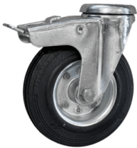
RAD MIT BREMSE Nicht spurtreues Rad mit integrierter Bremse