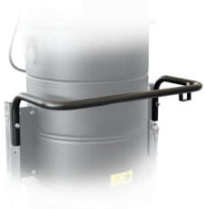
ASA DE EMPUJE