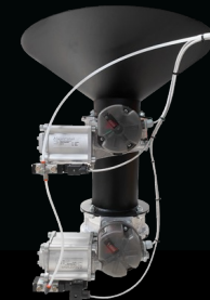
Valvola di scarico elettropneumatica a doppia farfalla