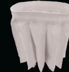
Filtro a stella Classe M